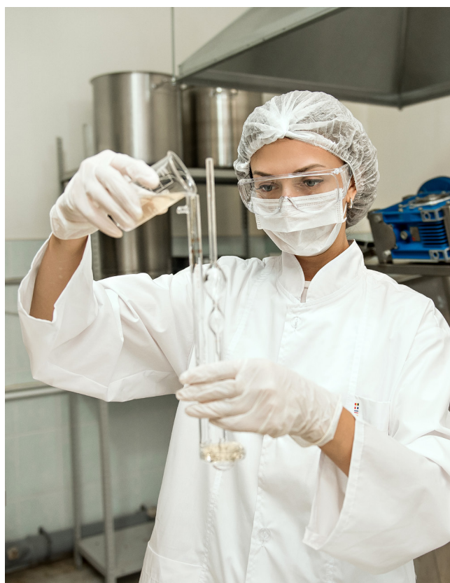
Инновационное производство био-комплекса COLLA GEN

Бестселлер — уникальный био-комплекс с пептидами коллагена и эластином — превосходит по составу даже японские препараты.