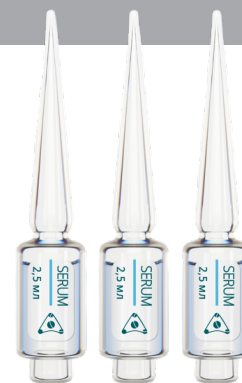
Биоактивная сыворотка для лица на основе «Живого Коллагена»