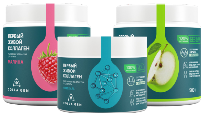
Био-комплекс с пептидами коллагена и эластином (Яблоко, Малина, Original)