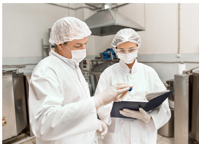
Инновационное производство био-комплекса COLLA GEN

В готовом био-комплексе нет красителей, ГМО, тяжелых металлов и вредных добавок. Запатентованная природоподобная технология позволяет получать коллаген с большим комплексом аминокислот, микро- и макроэлементами, жирными полиненасыщенными кислотами