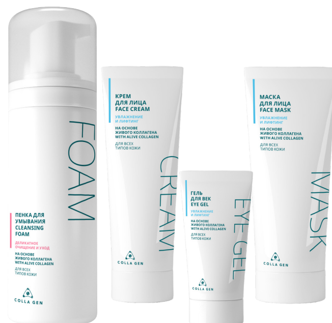
Линия косметики для лица на основе «Живого Коллагена»

«Живой Коллаген» абсолютно безопасен для пожилых, аллергиков, беременных, кормящих, детей, взрослых, за исключением тех, кто страдает индивидуальной пищевой непереносимостью или аллергией на куриный белок.