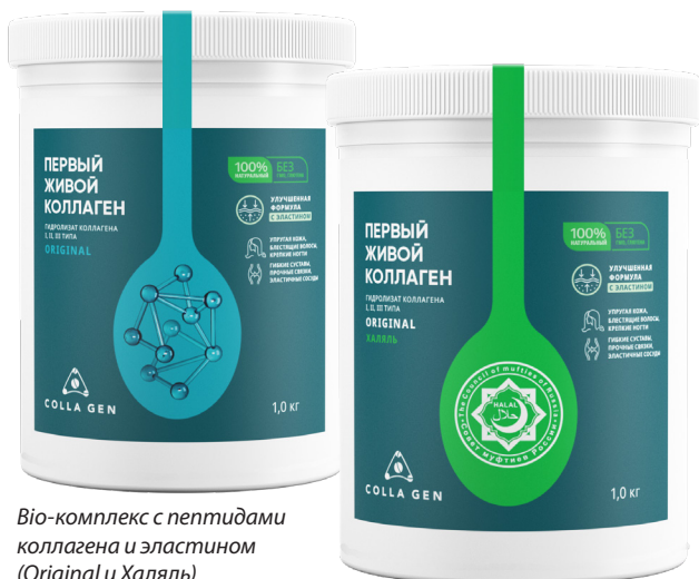
Био-комплекс с пептидами коллагена и эластином (Original и Халяль)